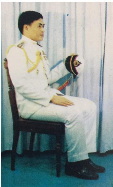
ทำนั่งถือกระบี่พร้อมหมวก