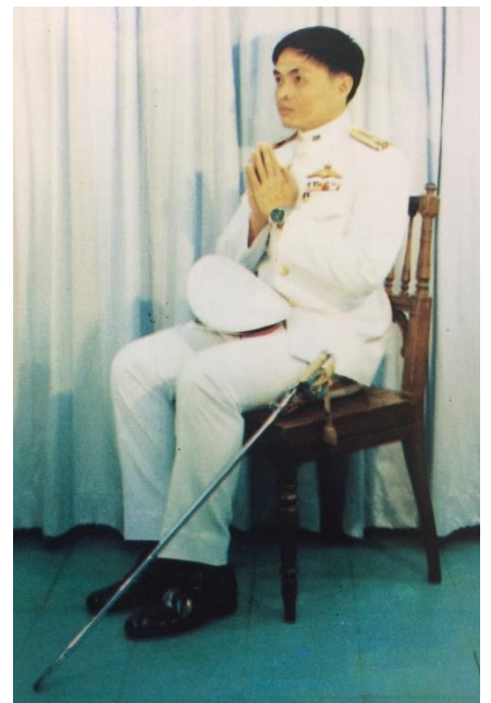
ทำนั่งไหว้พระเมื่อมีกระบี่