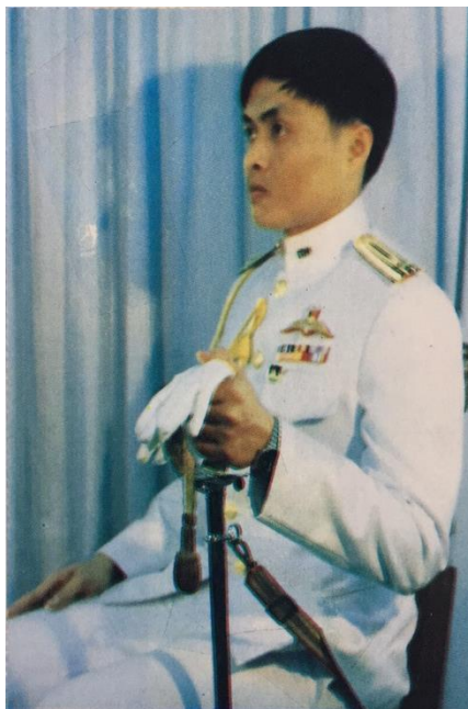
ทำนั่งถือกระบี่ไม่มีหมวก