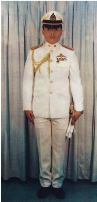
ทำยืนถือกระบี่สวมหมวก