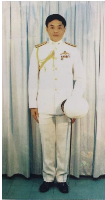
ทำยืนถือกระบี่ไม่สวมหมวก