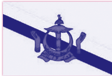
ธงประจำชาติ