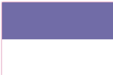
ธงประจำชาติ