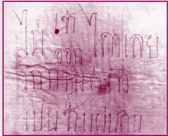
พระราชหัตถเลขาพระบาทสมเด็จพระจอมเกล้าเจ้าอยู่หัว เป็นผ้าลายพระหัตถ์เมื่อครั้งทรงผนวช พบที่พระปิ่นหย่า ซึ่งเป็นตำหนักที่ประทับ ณ วัดบวรนิเวศวิหาร

พระราชพิธีถือน้ำพิพัฒน์สัตยาและพระบรมวงศานุวงศ์ ข้าราชการทั้งฝ่ายหน้าฝ่ายในจัดดอกไม้ธูปเทียนเข้าไปถวายตัวตามราชประเพณี พระบาทสมเด็จพระเจ้าอยู่หัวโปรดเกล้าฯ ให้จัดของพระราชทานแจกผู้มีความดีความชอบมากน้อยกว่าพันคน