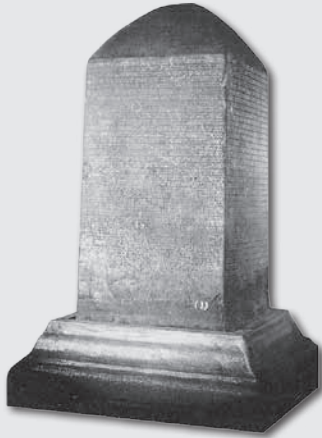
จารึกสุโขทัยหลักที่ ๑