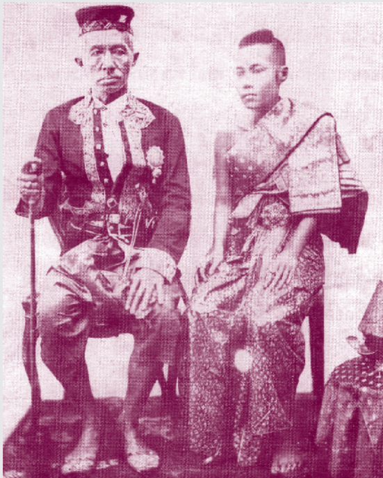
พระบาทสมเด็จพระจอมเกล้าเจ้าอยู่หัว และ สมเด็จพระเทพศิรินทราบรมราชินี ฉายเมื่อ พ.ศ. ๒๔๐๓

๑. สมเด็จพระเจ้าฟ้าชาย สิ้นพระชนม์ในวันประสูติ