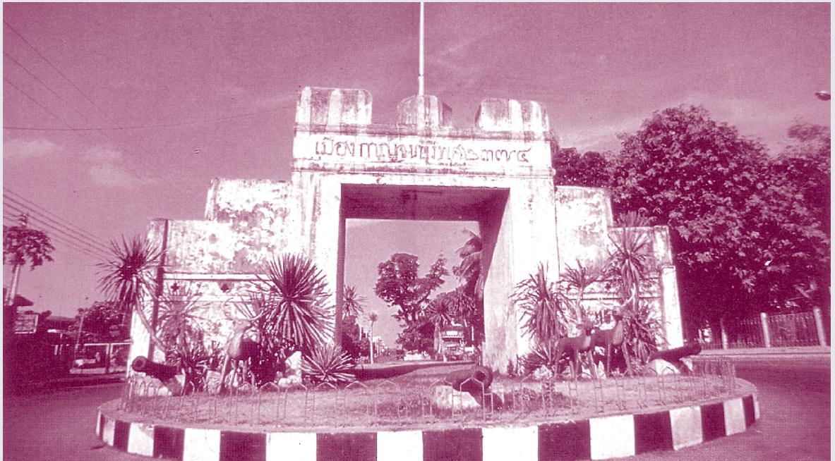
พ.ศ. ๒๓๗๕ โปรดให้สร้างป้อมปราการเมืองกาญจนบุรี เพื่อรับศึกพม่าทางด้านตะวันตก

เจ้าฟ้าฯ กรมขุนอิศเรศรังสรรค์นั้น ทรงชำนาญในวิชาการทหารปืนใหญ่อย่างหาผู้ใดเทียบได้ยาก เพราะทรงสนทนาคัดในภาษาอังกฤษ จึงทรงใช้เป็นเครื่องมือในการศึกษาวิชาวิศวกรรมการทหารเรือ และการปืนใหญ่อย่างแตกฉาน จนกระทั่งทรงแปลและแต่งตำราปืนใหญ่โบราณและตำราปืนใหญ่ไทยไว้เล่มหนึ่ง และทรงรับพระภารกิจเกี่ยวกับการปืนใหญ่ของกองทัพไทยมาตลอดรัชกาล ในเรื่องนี้ สมเด็จฯ กรมพระยาดำรงราชานุภาพทรงนิพนธ์ไว้ในตำแหน่งวังหน้าว่า