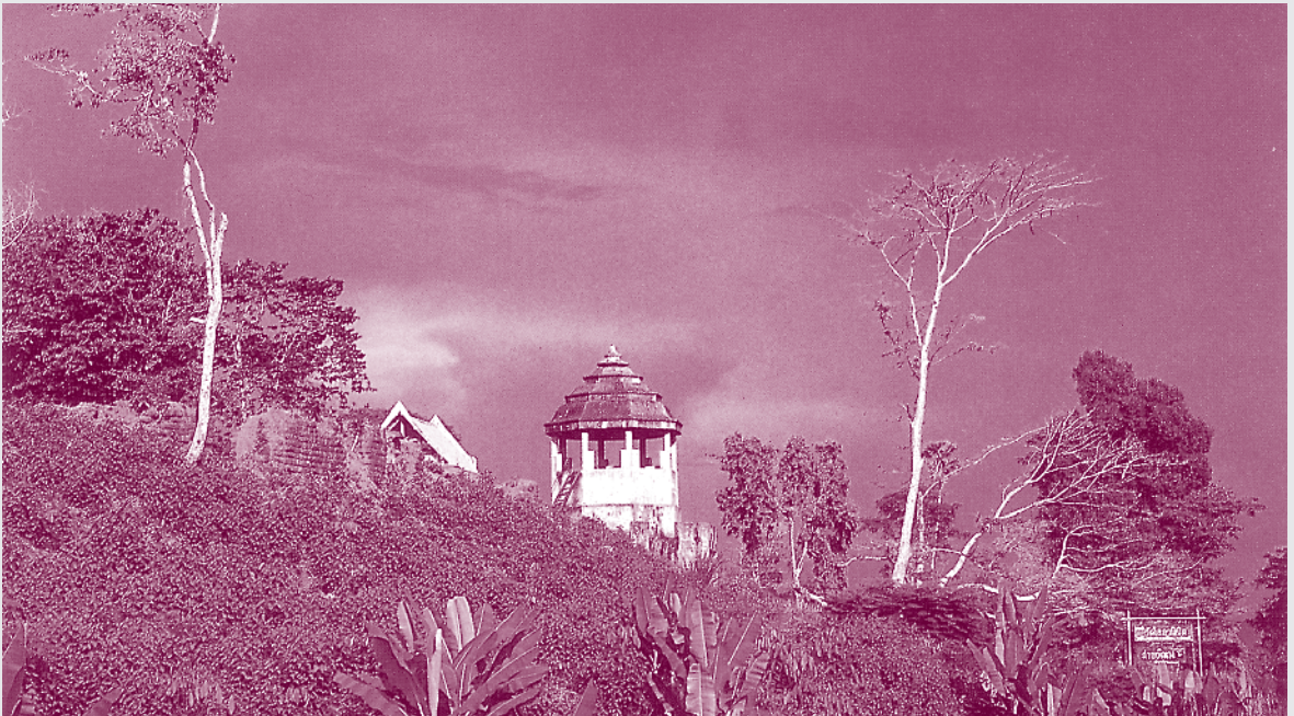
พ.ศ. ๒๓๗๙ โปรดให้สร้างป้อมที่ปากทะเลสาบ ต.บ่อทราย เมืองสงขลา

การสงครามกับพม่าก็มีน้อยลง แต่ก็ได้มีการยกทัพไปขับไล่กองทัพเจ้าอนุวงศ์ของลาว กาลในครั้งนี้ได้ปรากฏวีรกรรมของไทย คือ ท่านผู้หญิงโมต่อมาได้ทรงพระกรุณาโปรดเกล้าฯ ให้แต่งตั้งคุณหญิงโมเป็น “ท้าวสุรนารี”